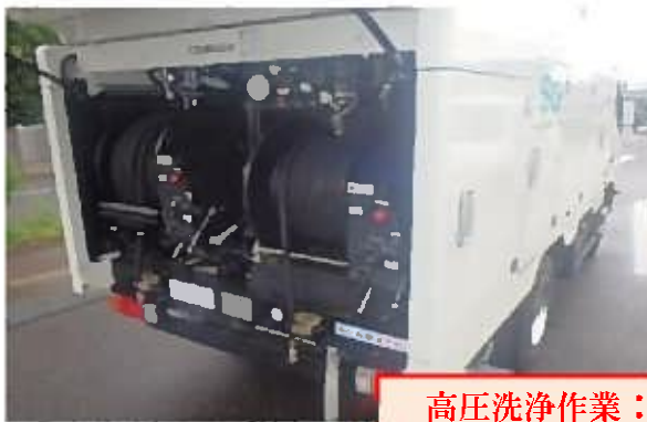
高圧洗浄作業：挿入した屋外枳