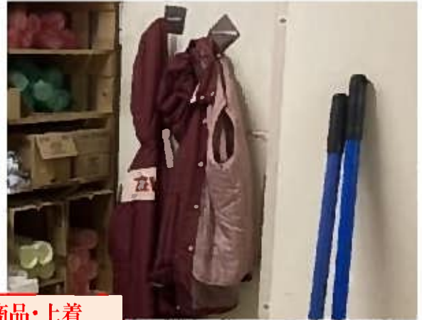
汚損させた商品・上着