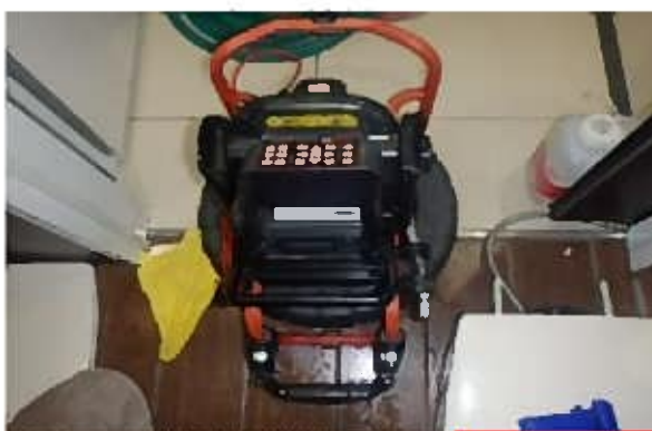
カメラによる調査を実施