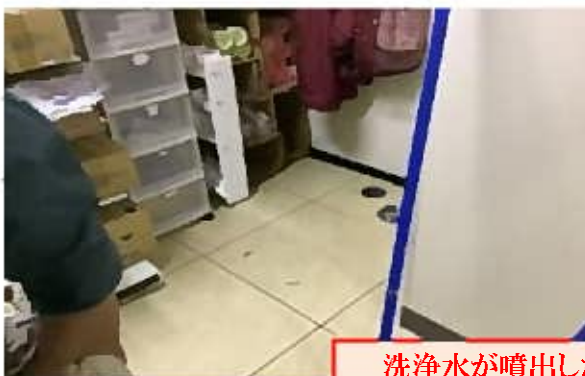
洗浄水が噴出した掃除口(接着処置)